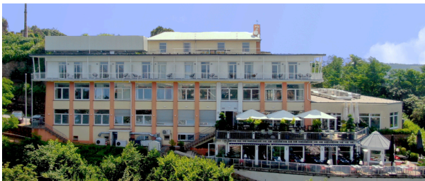
Schlossberg Hotel – Schlossberg-Höhenstraße – 66424 Homburg